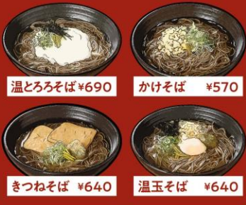
温とろろそば ¥690 かけそば ¥570 きつねそば ¥640 温玉そば ¥640