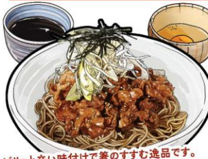
ピリッと辛い味付けで着のすむ逸品です。 温かいつけ汁に冷たいおそばをつけて お召し上がりください。

冷しとろろそば ¥690 冷しきつねそば ¥640 冷しぶっかけそば ¥570 冷しちくわ天おろしそば ¥690 冷し温玉そば ¥640 ざるそば ¥570