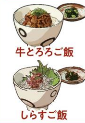
牛とろろご飯 しらすご飯