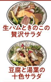
生ハムときのこの 贅沢サラダ 豆腐と湯葉の 十色サラダ